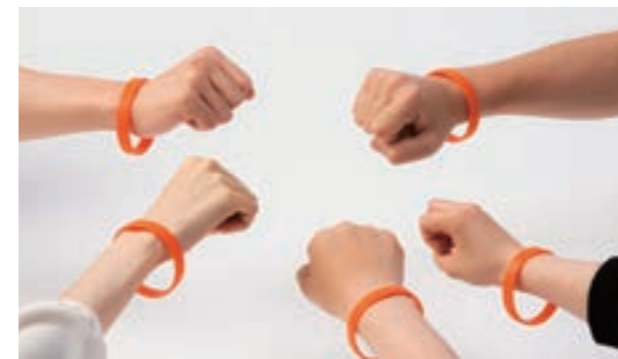
認知症サポーターに渡される「オレンジリング」

日本調剤グループでは「認知症サポーター養成講座」の開催や、「認知症サポーター100万人キャラバン」に参加する等、認知症の方が安心して暮らせる環境づくりに貢献しています。現在、約1,000名の社員が認知症サポーターとして活躍しています。