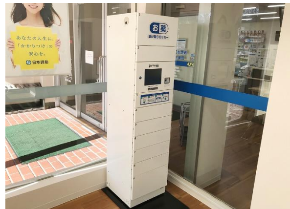
薬局内に設置されたスマートピックアップロッカー

日本調剤 菅生薬局は聖マリアンナ医科大学病院の敷地内に位置する、24時間営業の薬局です。このたび薬局入り口付近に新たにスマートピックアップロッカーを設置し、いつでも非接触で処方薬を受け取ることが可能となりました。患者さまの薬局での待ち時間を短縮することで、新型コロナウイルス感染拡大防止に寄与します。また、病院にお勤めの方々にも休憩時間に処方箋を受付の上、勤務後にロッカーで処方薬をお受け取りいただくなど、24時間いつでも便利にご利用いただける体制を整えました。