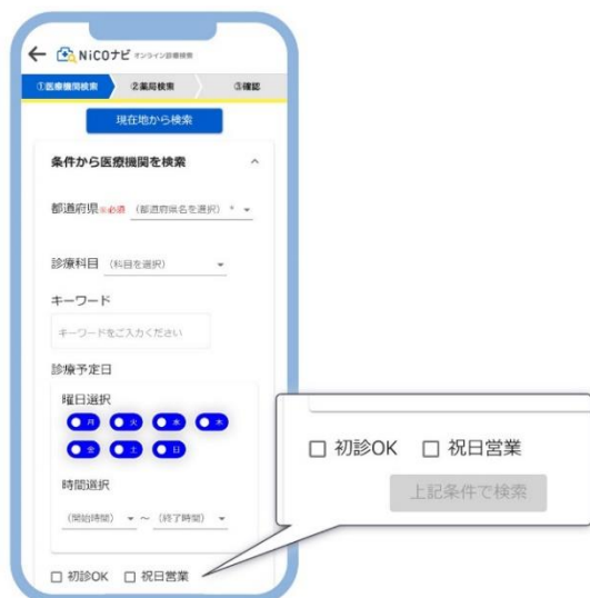
祝日に営業している医療機関も検索することができます