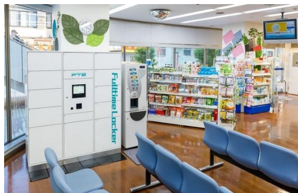
【非接触での処方薬の受け渡しを実現】